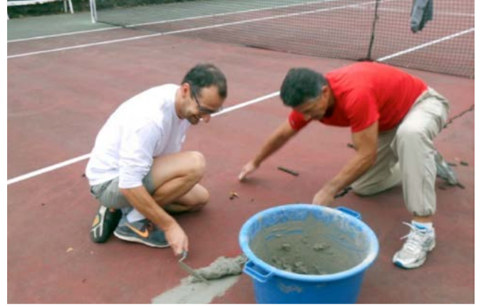
Chantier 6 : terrain de tennis