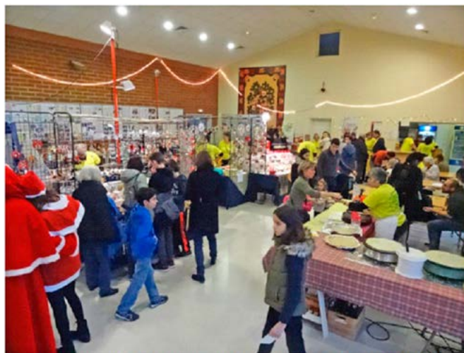
Toujours beaucoup d'affluence le samedi après midi autour du Marché de Noël et du stand de crêpes.