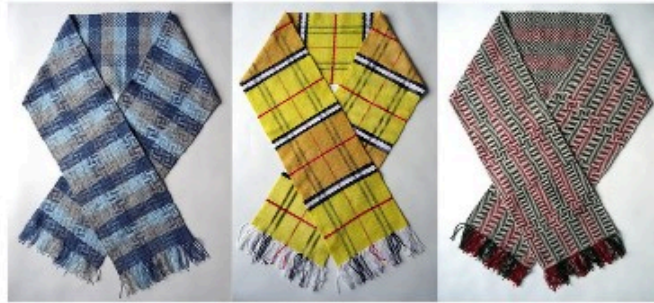
Écharpes tissées à la main