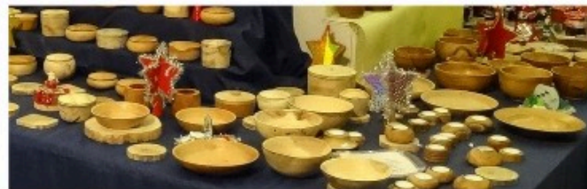
Objets en bois tourné