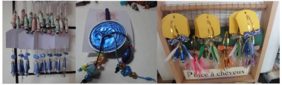
Bijoux « pause café »