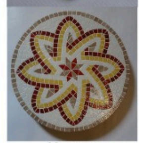
Mosaïques Dessous de plat et plateau tournant

Si vous avez une envie soudaine d'offrir un petit cadeau, n'hésitez pas à nous contacter sur le blog de l'association