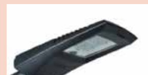
Modèle routier NAICA SMALL

Lors du Conseil Municipal du mois de décembre 2019, le renforcement de l'éclairage des passages piétons sur la RD94 a été approuvé (au niveau des 2 carrefours : de l'église et du chemin Lasserre).