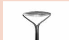
Modèle Résidentiel OYO